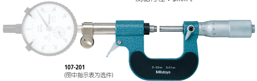
107-201 (图中指示表为选件)